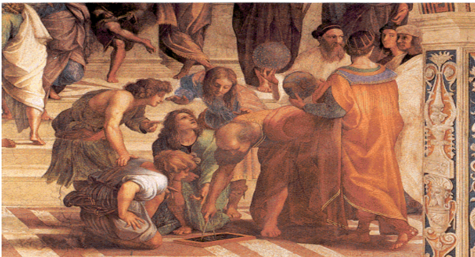
Raffael - Die Athener Schule (Ausschnitt)

den materiellen Erfolg und Besitz vermittelt haben.